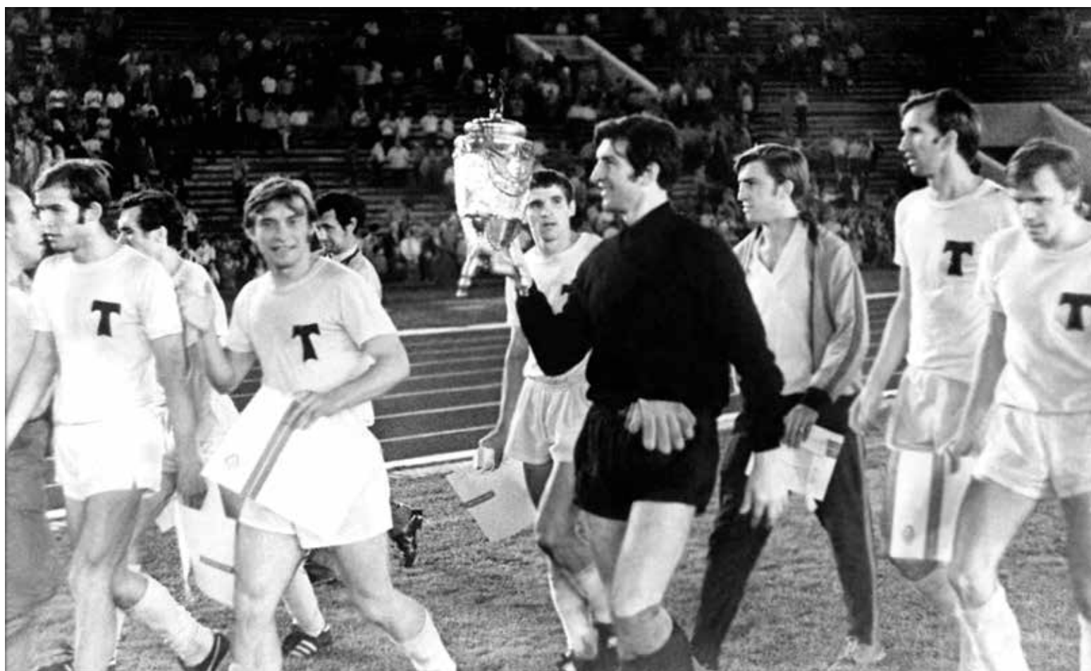
Легенды отечественного футбола